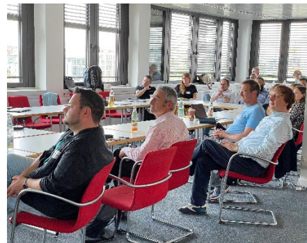
Abschlussveranstaltung Themenzertifikat im BayZiel

Das BayZiel – Bayerisches Zentrum für innovative Lehre ist eine gemeinsame Einrichtung in Trägerschaft der bayerischen Hochschulen für angewandte Wissenschaften und Technischen Hochschulen. Das BayZiel bündelt Aktivitäten der Hochschulen in den Bereichen „Qualifizierung und Didaktik“, „Lehr- und Lernforschung“ sowie „Praxis und Transfer“. Es ist auf ein langfristiges institutionalisiertes Zusammenwirken der Hochschulen im Bereich der innovativen Lehre ausgerichtet und unterstützt mit seinen circa 20 Mitarbeiterinnen und Mitarbeitern etwa 6.000 Lehrende. www.bayziel.de